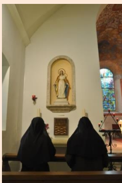
Les deux moniales en prière

Avoir de quoi vivre est nécessaire à chacun, mais savoir pourquoi vivre lui est tout aussi indispensable. C'est pour que ce sens final de la vie humaine soit manifesté en permanence, que Dieu appelle certains à s'investir totalement dès ici-bas dans les « Réalités d'En-Haut ». C'est la rencontre de l'Amour entre Dieu et ses créatures.