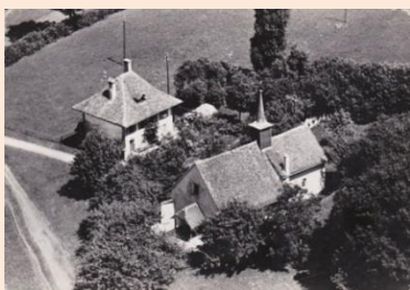
Photo prise durant la première moitié du 20 e s.

Considérée comme le plus ancien ermitage du canton de Fribourg, la chapelle est mentionnée dans les sources écrites du XI e s. Une recluse y vit en 1300. Plusieurs ermites se succèdent à partir de la fin du 15 e s.