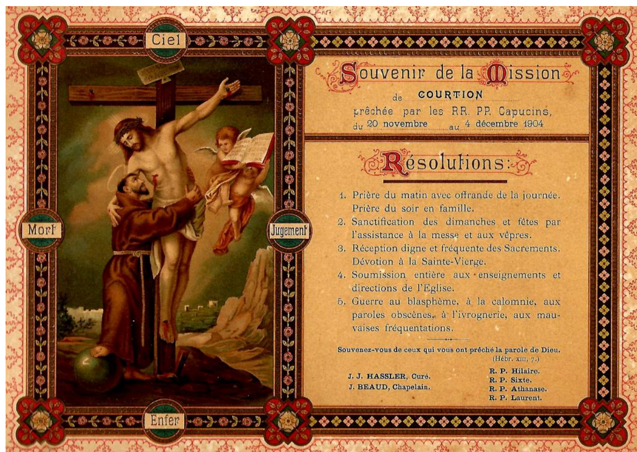
Tableau qui rappelle le souvenir de la Mission qui a eu lieu dans la paroisse de Courtion du 20 novembre au 4 décembre 1904.